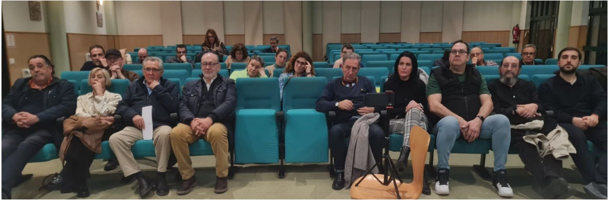
Imagen del público asistente