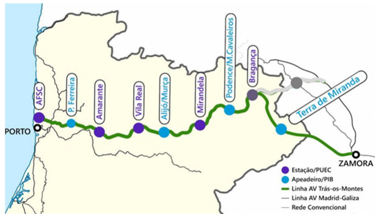
Mapa de línea de ferrocarril de Oporto a Zamora que promueve la asociación Val'Douro